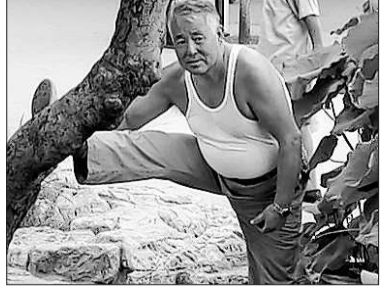
Balanceakte beim Tai Chi.

Besonders erstaunlich wirken Agilität und Gesundheitsbewusstsein der Senioren gerade im Kontrast zur immer größeren Umweltverschmutzung in Chinas Hauptstadt. Die Wasserqualität lässt zu wünschen übrig, und hinter dem Vorhang aus Abgasdunst und Feinsand der nur 150 km entfernten Taklamakan-Wüste baumelt die Sonne oft wie ein licht-