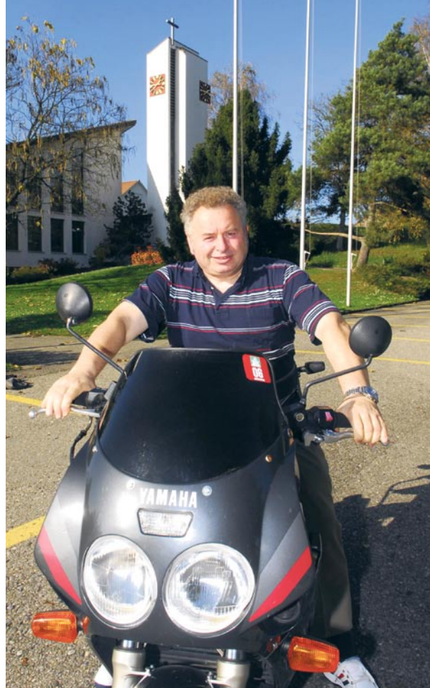
...und als Biker vor dem Kirchenzentrum.