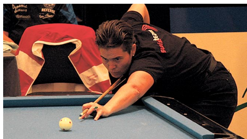
Höchste Konzentration auf dem Weg zu EM-Gold.