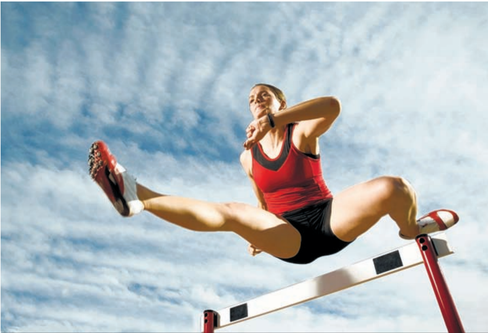
Immer weiter, immer höher: Mit Gendoping sind vielleicht schon bald noch grössere Leistungssteigerungen möglich.