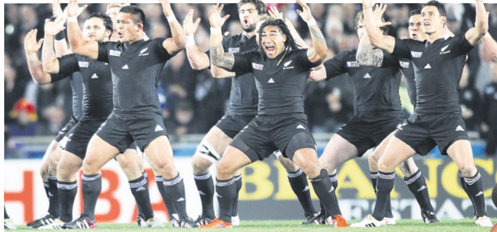
L'équipe nationale de rugby néo-zélandaise peut compter sur le système éducatif national, qui permet et promeut la pratique de ce sport dès le plus jeune âge.

Tout commence par la génétique. «Les Jamaïcains, Afro-Américains et autres, originaires d'Afrique de l'Ouest, sont les rois du sprint car leur squelette est adapté pour la vitesse», explique Beat Glogger, journaliste scientifique et auteur de «Lauf um mein Leben» («Courir pour ma vie»), un ouvrage qui analyse l'influence de la génétique sur la performance. «Les Africains de l'Est (Kényans, Ethiopiens), eux, battent des records sur les longues distances grâce à une morphologie plutôt petite et svelte. Quant aux Caucasiens (Européens), ils sont les rois des épreuves de force